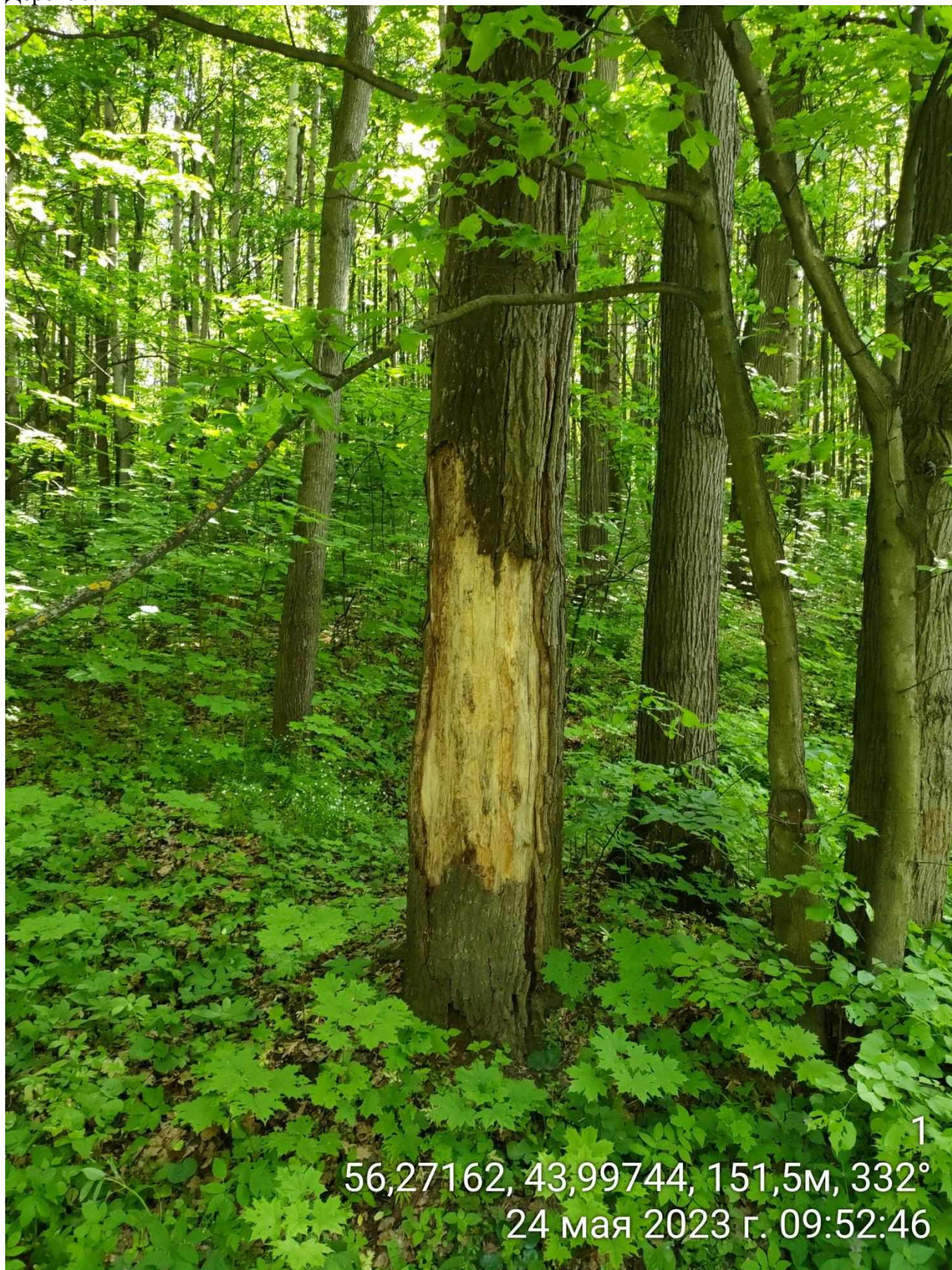
Дерево № 1